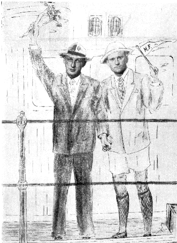
Her har vi våre to utsendte medarbeidere like før avreisen. Litt beveget, men det er jo så rart med den avskjeden. —

«Hunsfosposten» ønsker dem alle en riktig god reise.