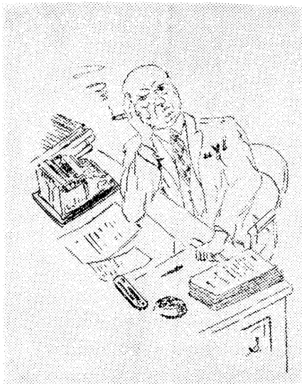
Herav fremgår at salgssavdelingen for en stor del må arbeide etter skjønn,