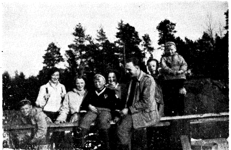
Påskeferien slutt — avreise fra Hunsfosheimen.