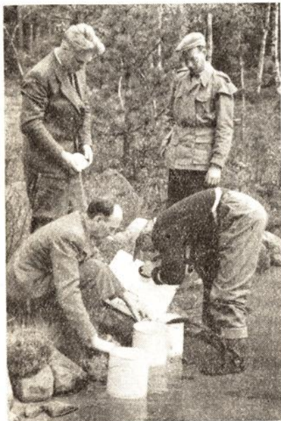
Yngelen overføres fra transportkaret til slippekarene.