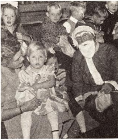
Et par av de minste som syntes julenissen var en koselig kar.

lig sving på den. Festlig var det! Til slutt kom så julenissene og satte prikken over i-en. De hadde også i år med seg kasse på kasse med innholdsrike poser til alle barna. Ja, det var noe til fest! Intet under at barna av sine lungers fulle kraft ga uttrykk for sin takknemlighet i et samstemmig: Tusen takk for festen!