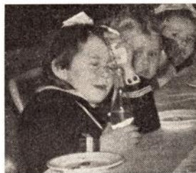
ja, nesten for godt.